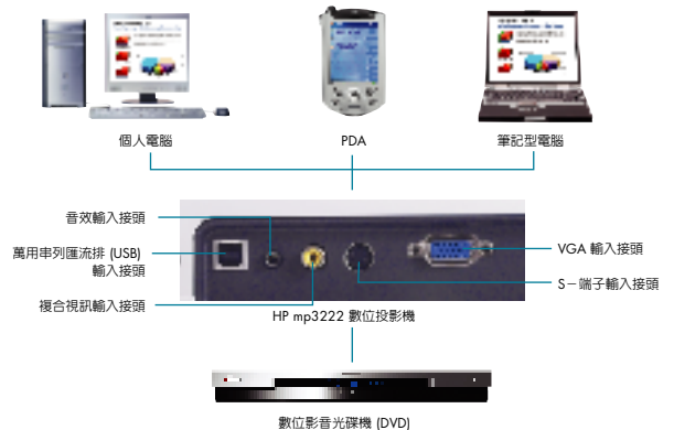
可輕易地連接多種輸入來源