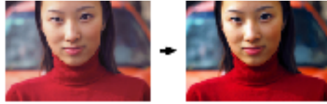
2000:1 高對比度的生動逼真影像