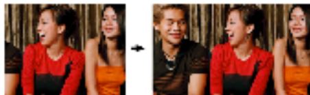
16:9 寬螢幕模式讓您看到更大的投影範圍

針對需要經常外出工作的專業人士，HP 特別為您量身訂做全新的數位投影機，可以幫助您用於所有重要的銷售宣傳或產品發表會。HP mp3222 數位投影機是一台高機動性、容易使用且功能強大的專業會議工具，可為您的專業能力帶來震撼性的效果外，更棒的是，其價格絕對在您可接受的預算內。