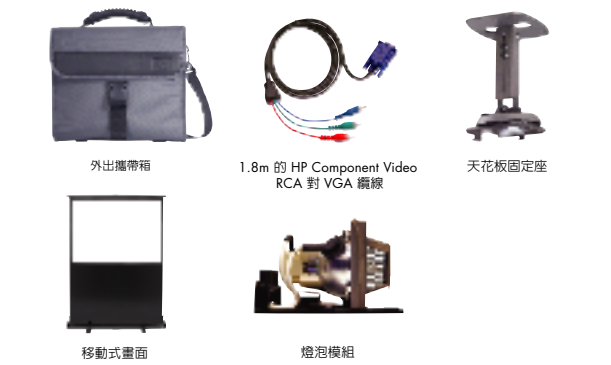
可讓您在會議中所使用的各項選購配件