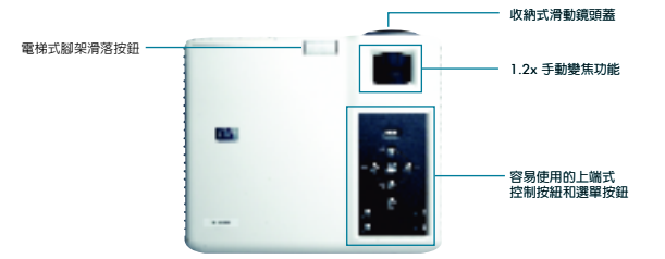
容易操作的工效學功能

HP mp3222 數位投影機還擁有許多可以和它相容的配件，以便提供您更大的彈性和方便性。包括了可將投影機、筆記型電腦和配件收在一起的攜帶箱、多種的音效和視訊纜線以及備用的燈泡模組。