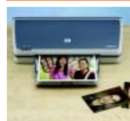
有边距或无边距的照片打印