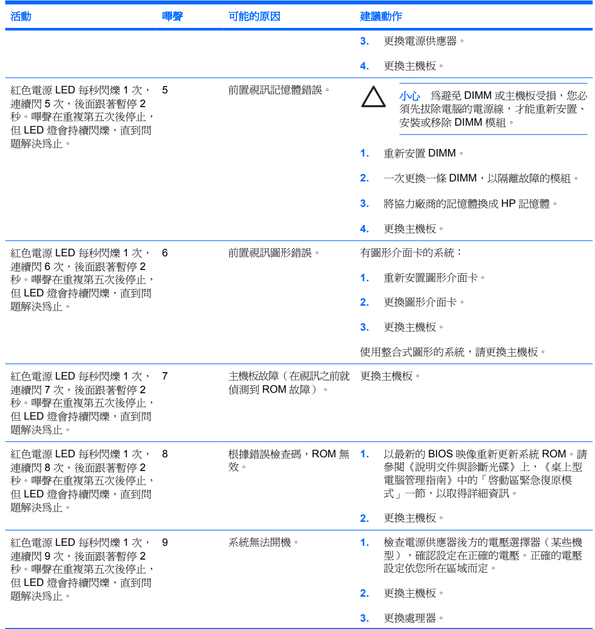
表格 A-2 診斷正面面板 LED 和警示聲（續）