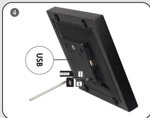
Step 4: Insert memory cards