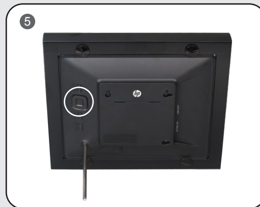
Step 5: Push the power button