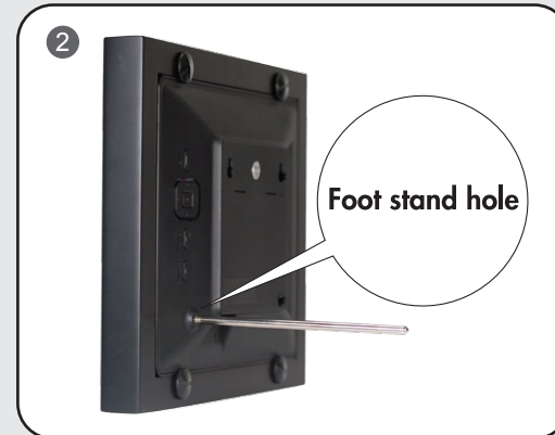
Step 2: Install the foot stand