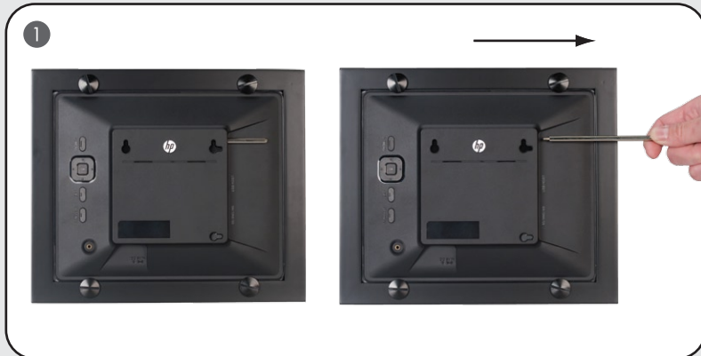
Step 1: Remove the foot stand from its storage slot