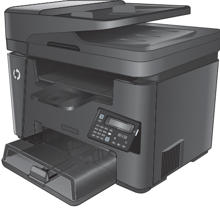
M225dn M225rdn M226dn