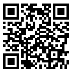
Suporte do produto