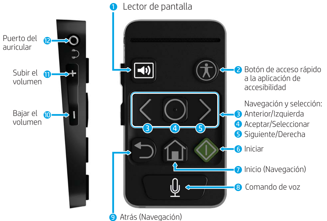
Tabla 2-1 Funciones del producto y orientaciones